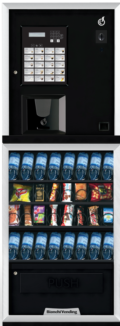
LEI300 SMART + ARIA S SLAVE